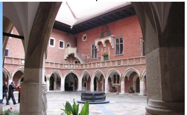
Le Collegium Maius