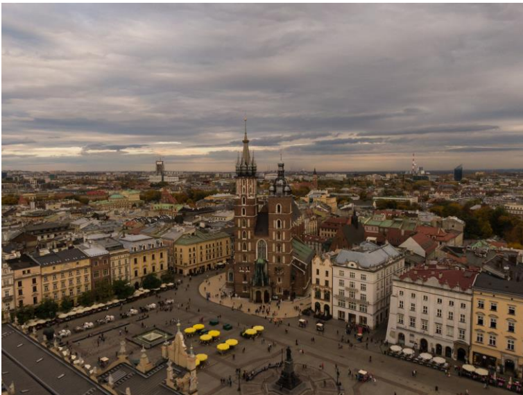
La Grande Place