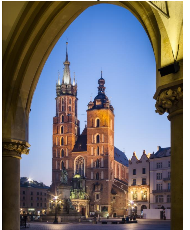
L'église Notre Dame