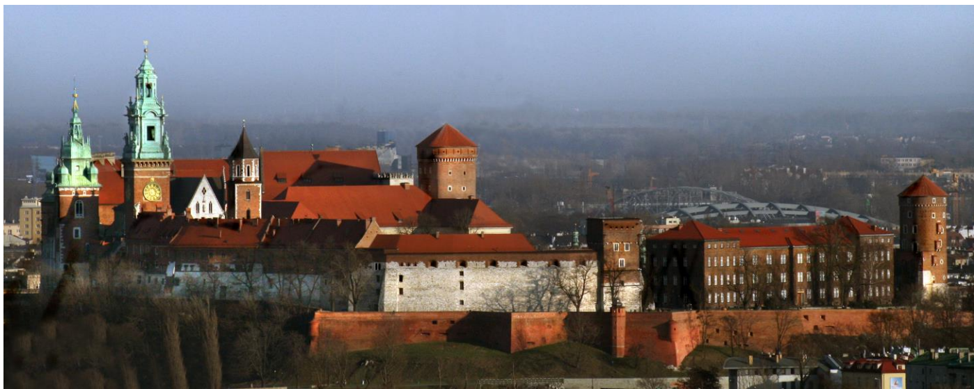
Wawel vu du Tertre Kosciuszko