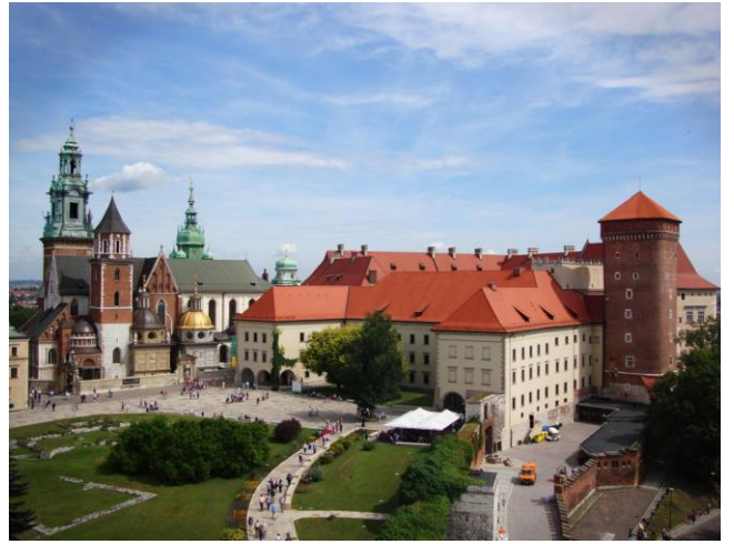
Le château de Wawel et la cathédrale