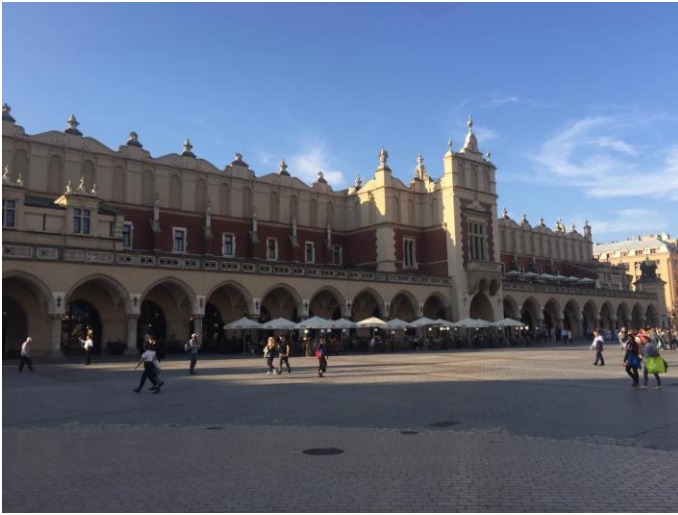
Les Halles aux Draps