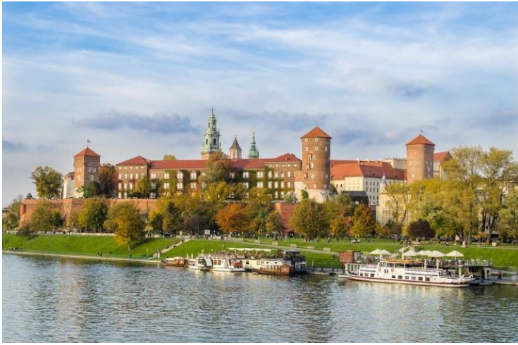
Le château de Wawel