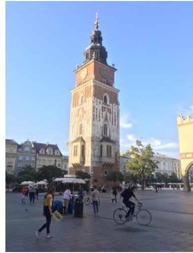
Le beffroi de l'Hôtel de Ville