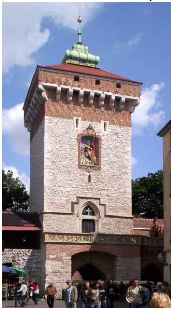
La Porte Saint Florian